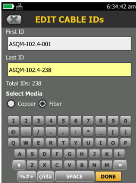
Touchscreen keyboard for faster data entry than the DTX

Esperar es lo opuesto a rapidez, pero si la batería del DTX se agota por completo, la tiene que enchufar y esperar hasta 15 minutos. Con Versiv, simplemente se conecta y se comienza a realizar pruebas. No pierda tiempo buscando comprobadores. LinkWare Live rastrea la última sincronización de su comprobador. Y para los enlaces que fallen, Versiv ofrece diagnósticos